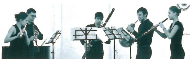
Духовой квинтет Sui generis (г. Москва)

23 ноября музыка отечественных композиторов XX века и живопись Р. Асланяна объединились в одном концерте в рояльном зале Художественного музея.