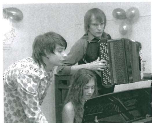
Подготовка к Посвящению - дело серьезное.