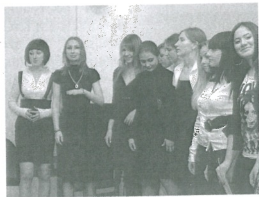
Фрагмент посвящения вокалистов.