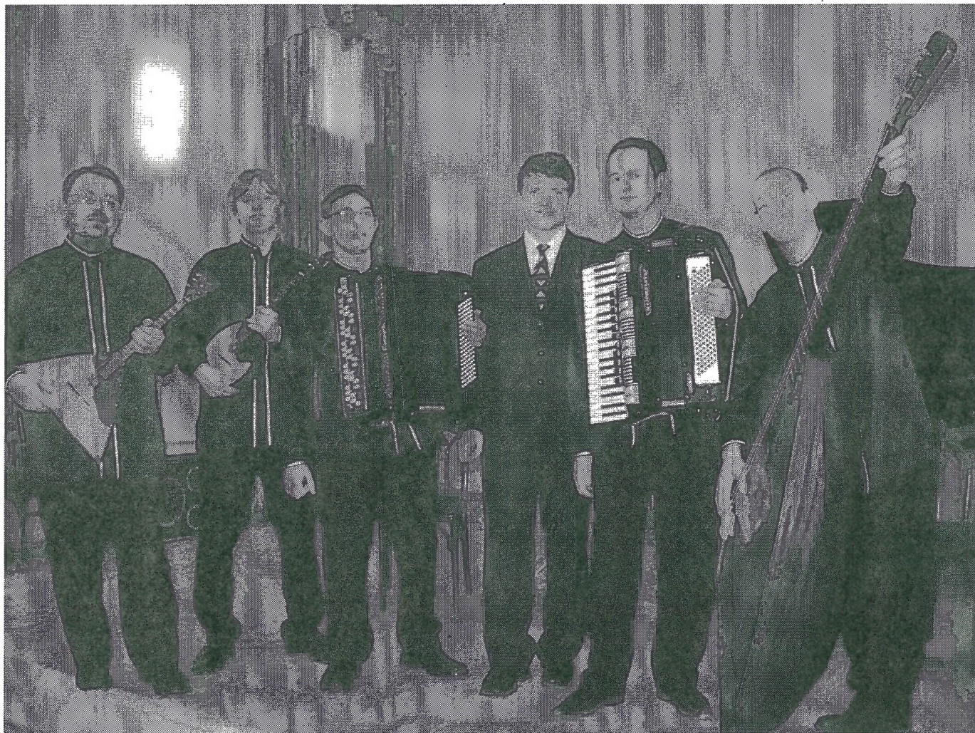
Ансамбль народных инструментов "Экспромт", 2005 г.