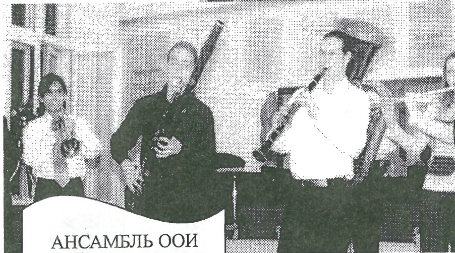
АНСАМБЛЬ ООИ (2003 ГОД)