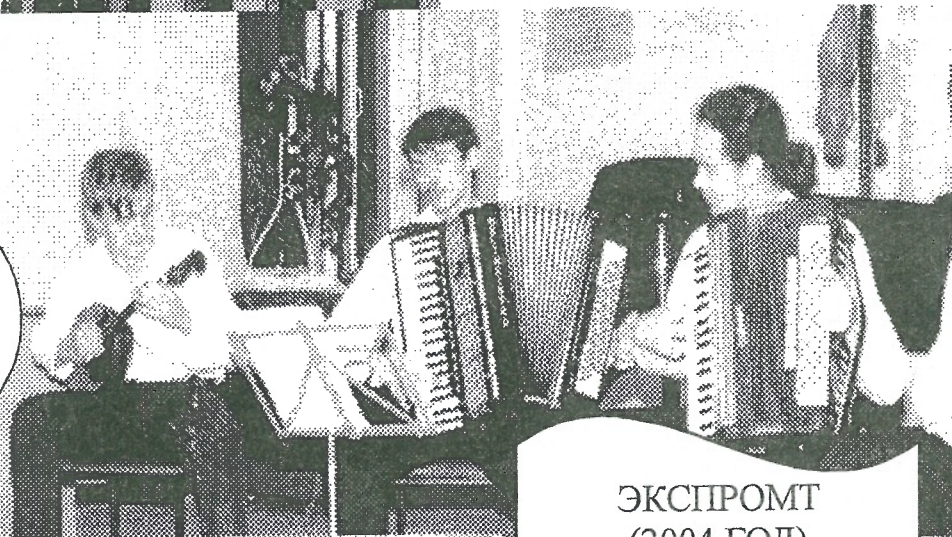
ЭКСПРОМТ (2004 ГОД)